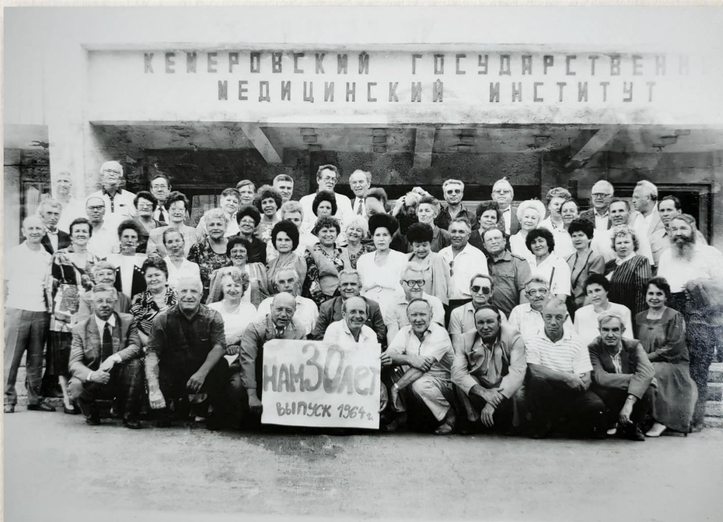
Встреча курса через 30 лет, 1994 г.