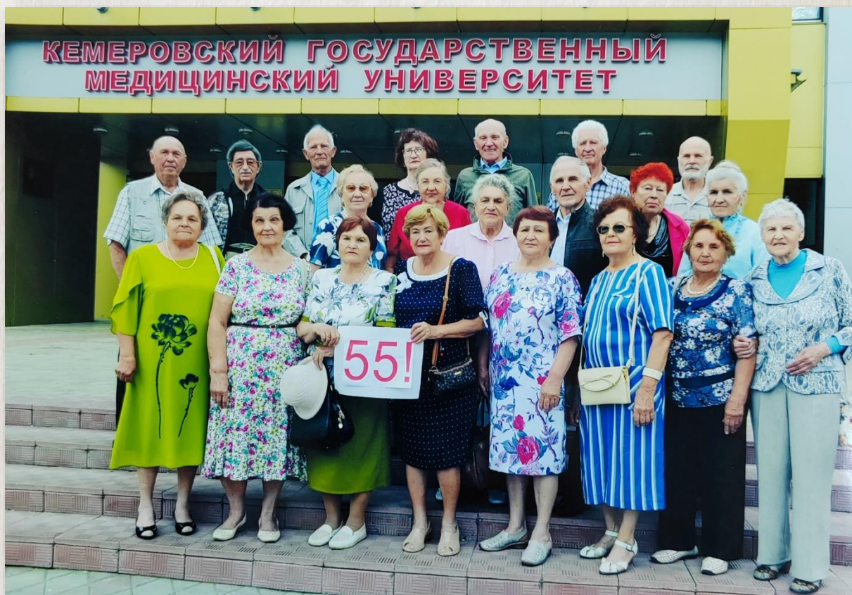
55 – летие после выпуска, 2019 г.