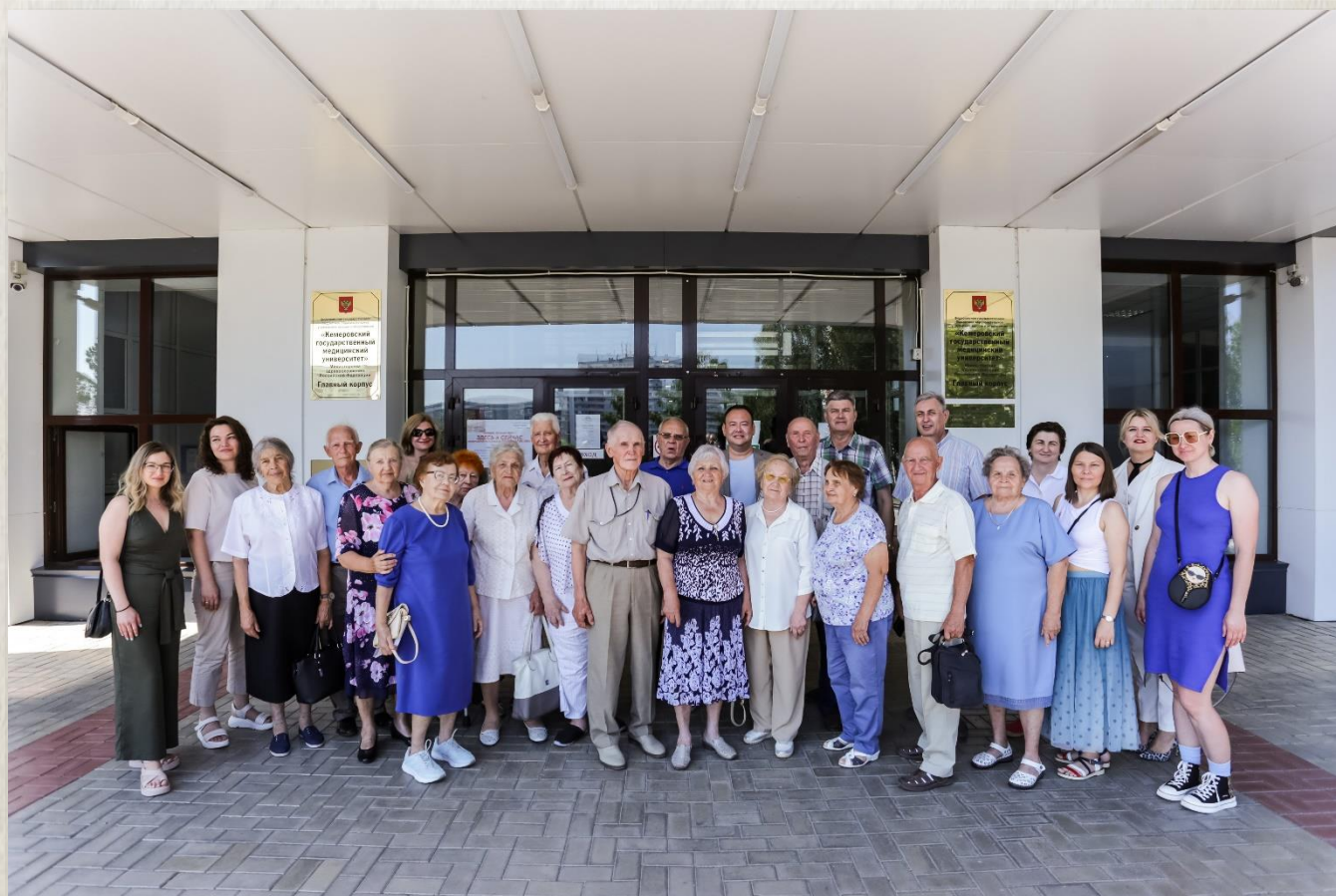
60 лет спустя, 2024 г.